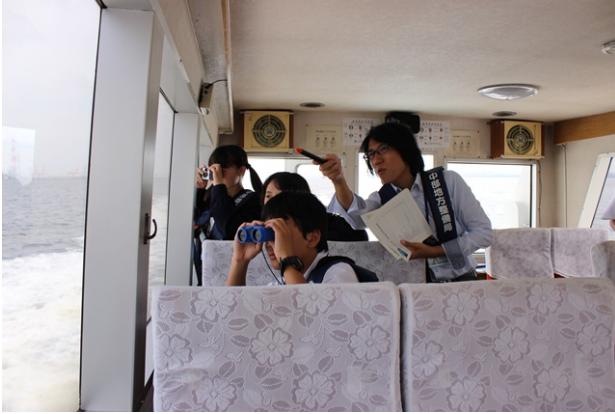
平成 26 年 5 月 20 日 港内見学の様子