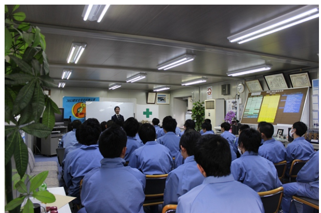
平成 26 年 12 月 10 日 港内見学の様子