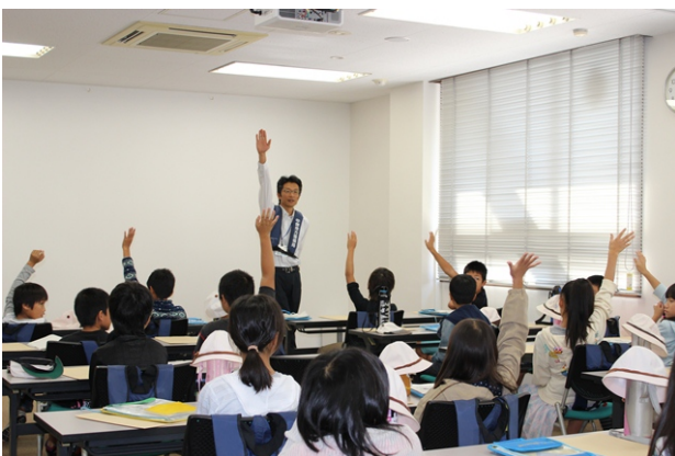
平成 26 年 10 月 7 日 港内見学の様子