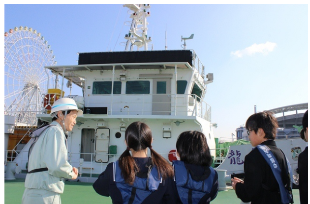
平成 27 年 1 月 20 日 港内見学の様子