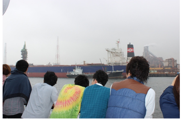
平成 26 年 10 月 22 日 港内見学の様子