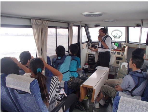
平成 26 年 7 月 11 日 港内見学の様子