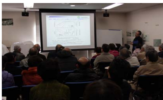
伊勢湾の環境についての説明