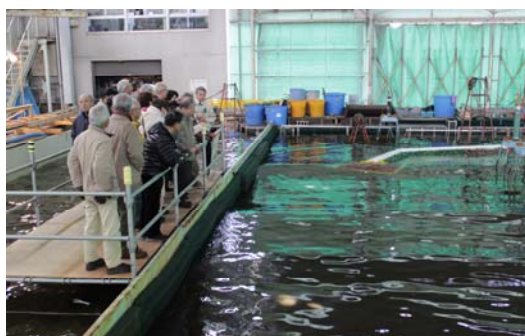
平面水槽での防波堤効果実験の様子