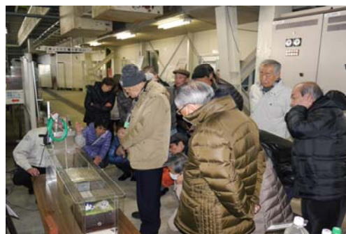
津波実験装置 見学の様子