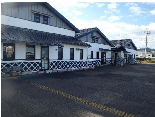
構成施設のイメージ