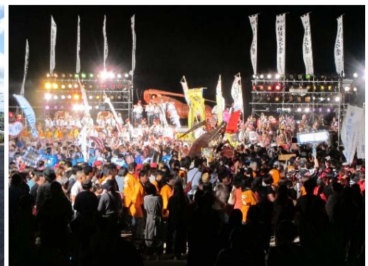
地域振興イベントの開催状況